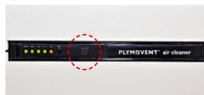
▲空氣質量感應器 (紅圈示) 設於機面, 橙色指示燈代表備用狀態、綠色指示燈代表4種風速選擇。