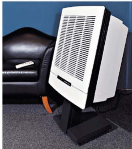
▲闊度與單座位梳化相近的座地式Euromate VisionAir 1, 可選擇以天花式安裝。