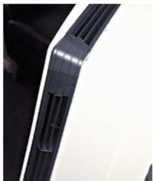
◀▲出風位設於機背的左、中、右位置, 每個出風位均設有風閘, 可靈活開關, 箭咀顯示關上狀態。