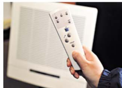
▲遙控器上的自動操作模式, 可配合空氣質量感應器使用。